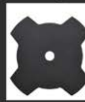
DT20655 23cm Τετράφτερος Δίσκος