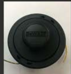
DT20656 Κεφαλή & Μεσηνέζα 2.5mm x 68.6m