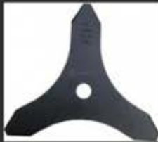
DT20653 25cm Τρίφτερος Δίσκος