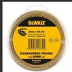
DT20651 Μεσηνέζα 2mm x 68.6m