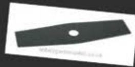
DT20654 25cm Μαχαίρι Κοπής