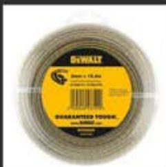
DT20650 Μεσηνέζα 2mm x 15.2m