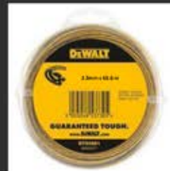
DT20652 Μεσηνέζα 2.5mm x 68.6m